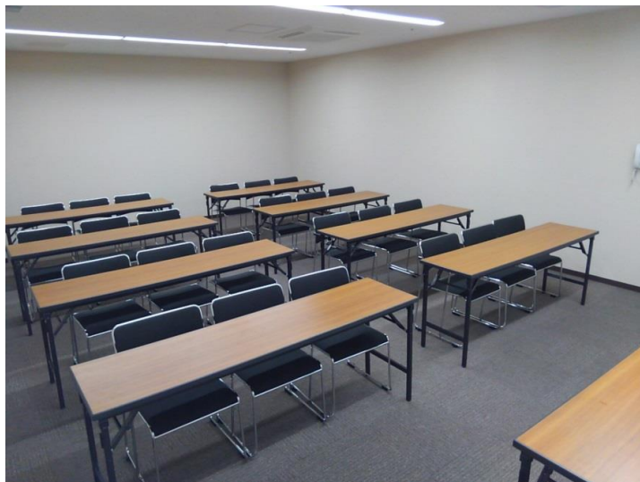
Bルーム (スクール形式24名 口型24名 / 42m 2 )