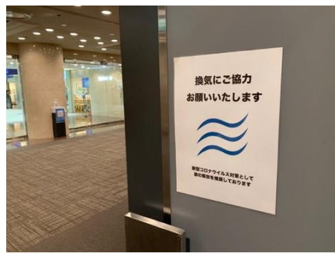
●ロビー～ホールの扉解放を喚起しています