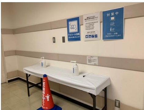
●関係者入口に消毒用アルコールを設置しています