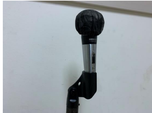
●マイクは消毒のうえ、カバーをして貸出いたします