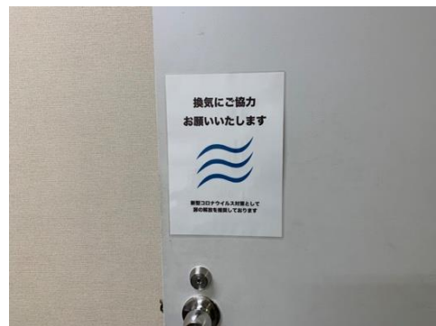
●楽屋の扉の解放を喚起しています