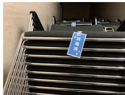
●消毒済の貸出備品にはシールを貼っています