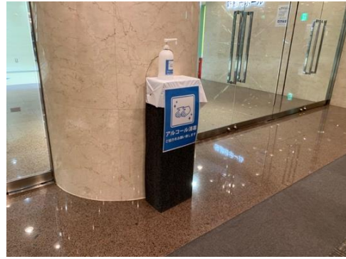
●会場入口に来場者用消毒用アルコールを設置しています