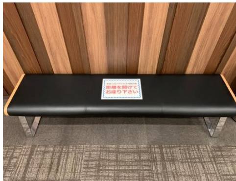
●ロビーのベンチに間隔をあけて座るよう喚起しています