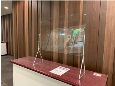
●受付用飛沫防止パネルをご用意しております（有料）