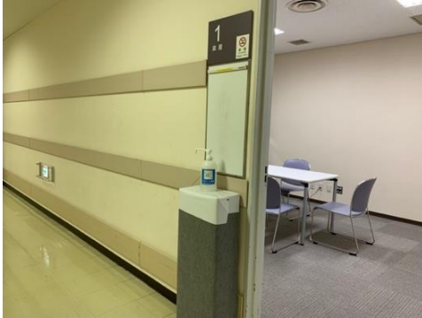
●楽屋入口に消毒用アルコールを設置しています