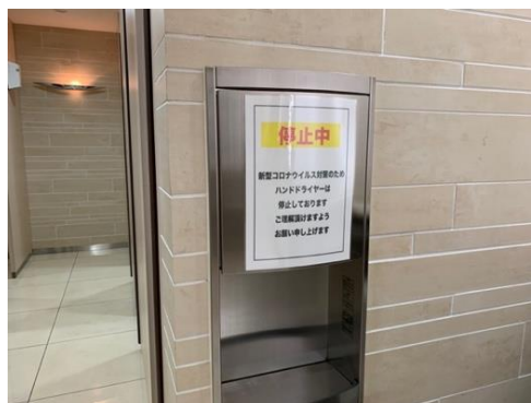
●トイレのエアードライヤーを停止しています