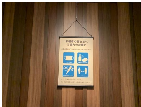
●来場者への感染防止啓発サインを掲示しています